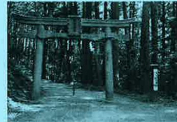
天乃石立神社入り口の大きな鳥居 あとひと頑張り

秋の行楽のシーズン到来!! 今回は奈良市内から近場で『石』に由来する場所です。 奈良市内よりバスまたは車で柳生の里を目指して約40分、城跡の近くにある駐車場に停め案内板を見ながら徒歩30分、鳥居を過ぎると間もなく目的地、ではお楽しみに。 次は車で移動、布目ダムの上流から月ヶ瀬に向かう途中「神野山」の看板があり坂道を進むとメーメー牧場の入り口が見えもう少し走ると右に【なべくら溪】入り口駐車場に停め(無料)☆散策開始。頂上展望台までは約40~50分大きな石を見ながら頂上目指して出発!!