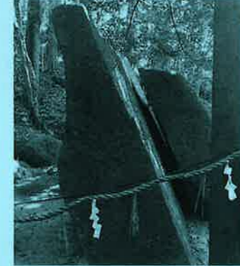
柳生家も崇敬した神話にまつわる巨石