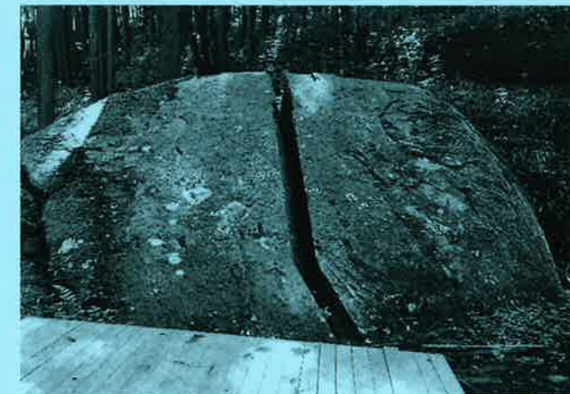
鬼滅の刃の聖地、柳生の一刀石です