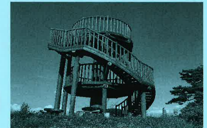
歩くこと40~50分神野山展望台到着

展望台からは大パノラマ、天気がよければ四方八方遠くの山並みも見える中でのお昼ご飯いかがですか