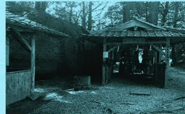
天乃石立神社は神秘的なパワースポットぜひご参拝ください。そしてこの奥に目指す待望の岩が!