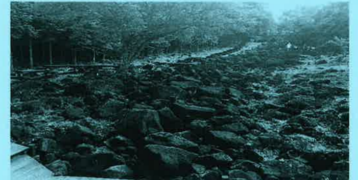
巨岩が長さ650mにわたって続き、谷を流れる水は岩石の下を伏流し岩の間から水音が聞ける