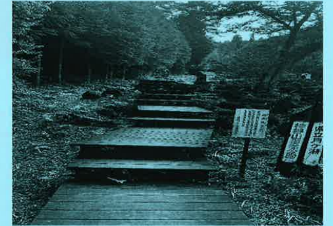
なべくら溪の脇に遊歩道、奇岩を見ながら出発