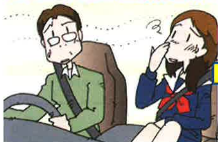
車両用クレベリン施工前イメージ

大幸薬品とデンソーが共同開発したクレベリン(二酸化塩素ガス)を活用した 車内除菌・消臭サービス