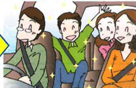
車両用クレベリン施工後イメージ