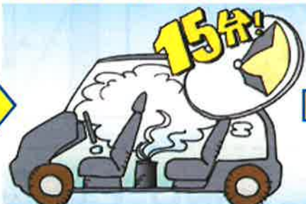
車両用クレベリン施工イメージ